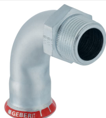
Imagen de ejemplo